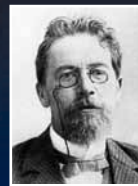
Антон Чехов, русский писатель

«После того как я бросил курить, у меня не бывает мрачного настроения»