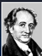
Иоганн Гете, немецкий писатель