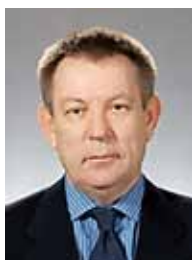
ГЕРАСИМЕНКО Николай Федорович, первый заместитель председателя Комитета по охране здоровья Государственной Думы Федерального Собрания Российской Федерации, академик РАМН