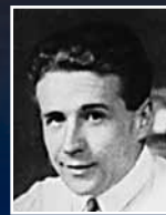
Жорж Сименон, французский писатель

«Начинаешь курить, чтобы доказать, что ты мужчина. Потом пытаешься бросить курить, чтобы доказать, что ты мужчина»