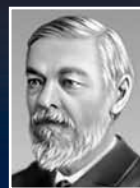
Иван Сеченов, выдающийся русский физиолог