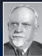
Николай Семашко, академик АМН СССР

«Всякий курящий должен знать, что он отравляет не только себя, но и других»