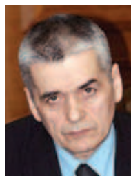
ОНИЩЕНКО Геннадий Григорьевич, руководитель Федеральной службы по надзору в сфере защиты прав потребителей и благополучия человека, академик РАМН